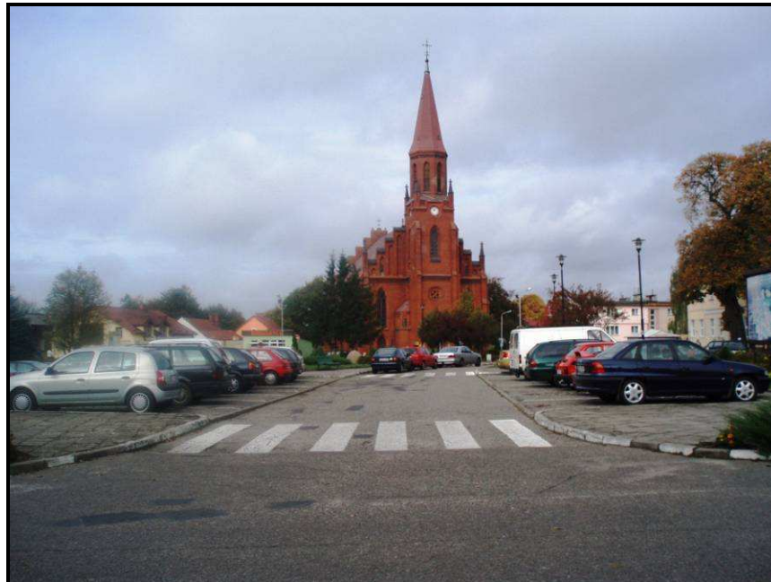
Fot. Istniejący stan bobolickiego rynku