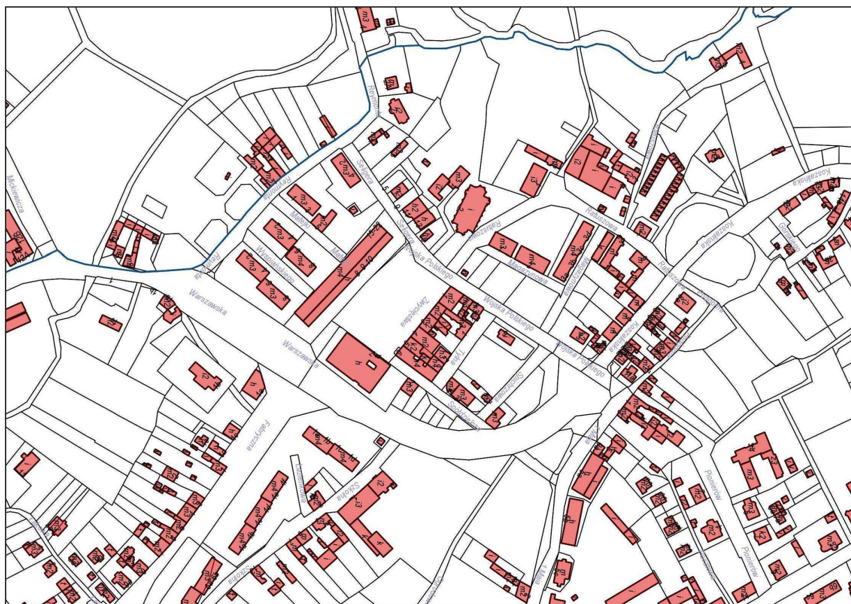
Mapa. Obszar wyznaczony do rozwoju Centrum miasta Bobolice

Wizja rozwoju centrum miasta Bobolice przedstawia wyobrażenie o jego przyszłości, do którego prowadzą cele ogólne, szczegółowe i działania projektowe. To pomysł na przyszłość zbudowany w oparciu o jego potencjały i dążenia.