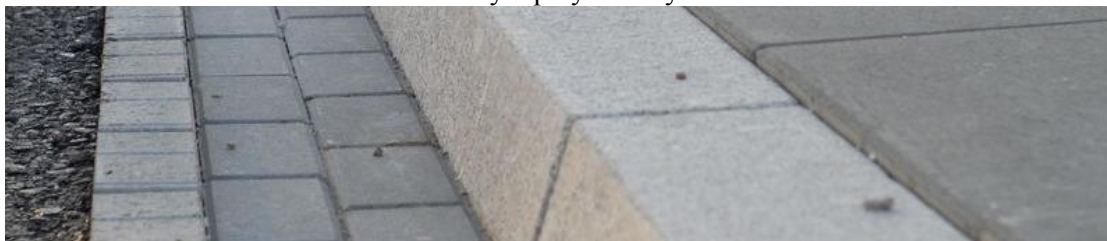
Ściek uliczny – przykład wykonania