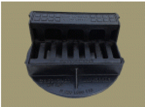
Rys nr 1 – wpust uliczny